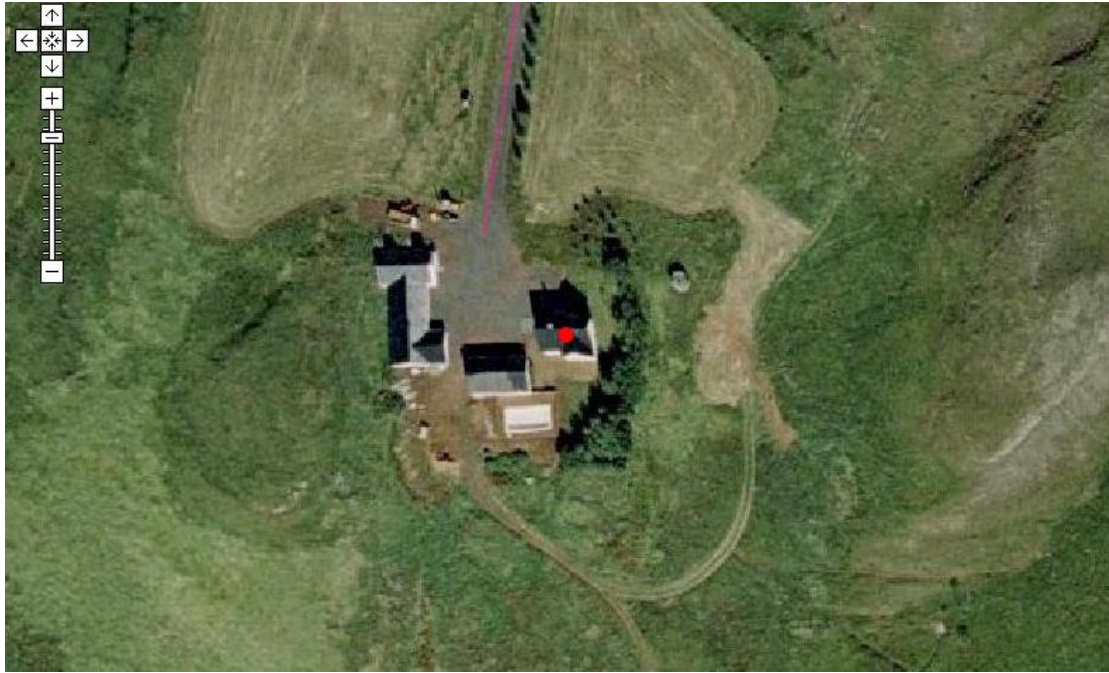
Mynd 1. Loftmynd af bæjarhúsum Galtar í Grímsnesi, úr vefsíðu Fasteignamats ríkisins (Þjóðskrá Íslands/Loftmyndir ehf. 2014).