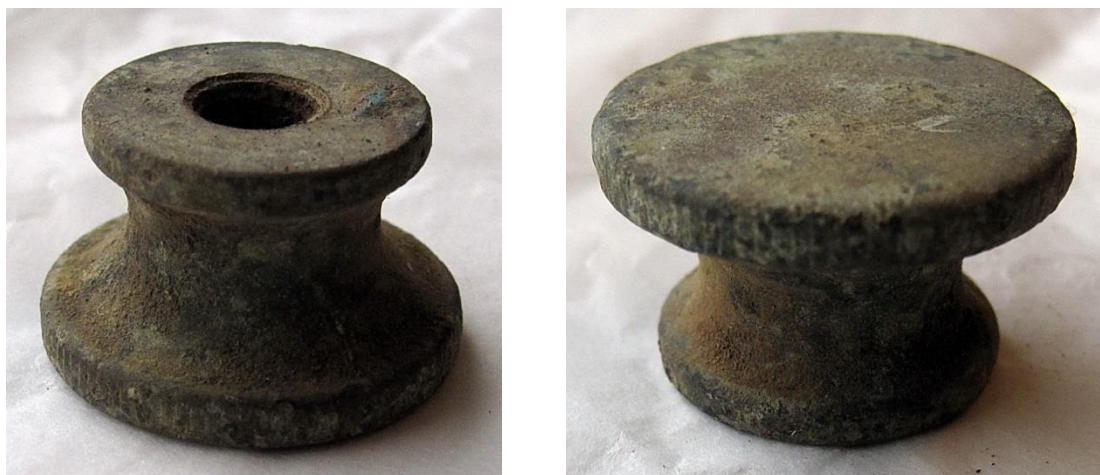
Mynd 5. Koparhnúður F. 1 (Ljósm. 1985-267-1_Göltur_20142506_JB_2 og 3).

Við rannsóknina fannst gripur úr kopar eða koparblöndu (F. 1) á 50 cm dýpi. Þetta virðist vera lítill hnúður eða halda af skúffu eða skáphurð.