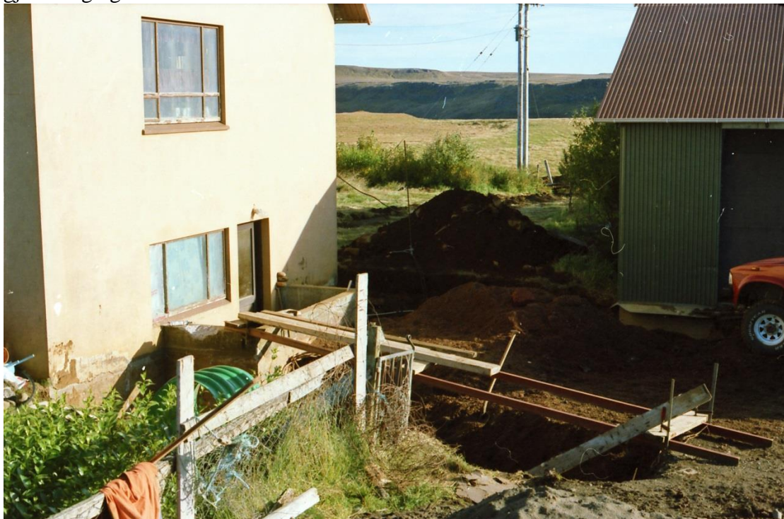
Mynd 2. Horft til suðurs yfir hálfyllt framkvæmdasvæði A, á bæjarhlaðinu milli íbúðarhúss og skemmu. (GÓL-1985-9111-6).