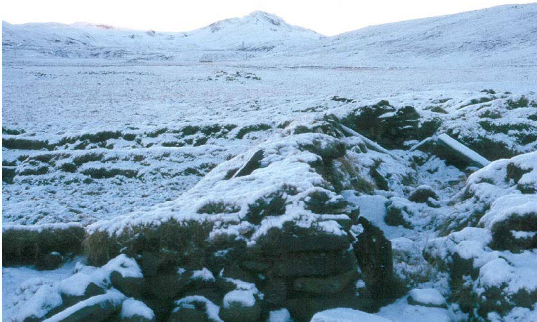
Mynd 4. Hluti af rústum gamla Ölfusvatnsbæjarins. Horft til suðvesturs. "Hofkofi" sést sem þúst í túninu, aftarlega fyrir miðju. (G.Ó.)