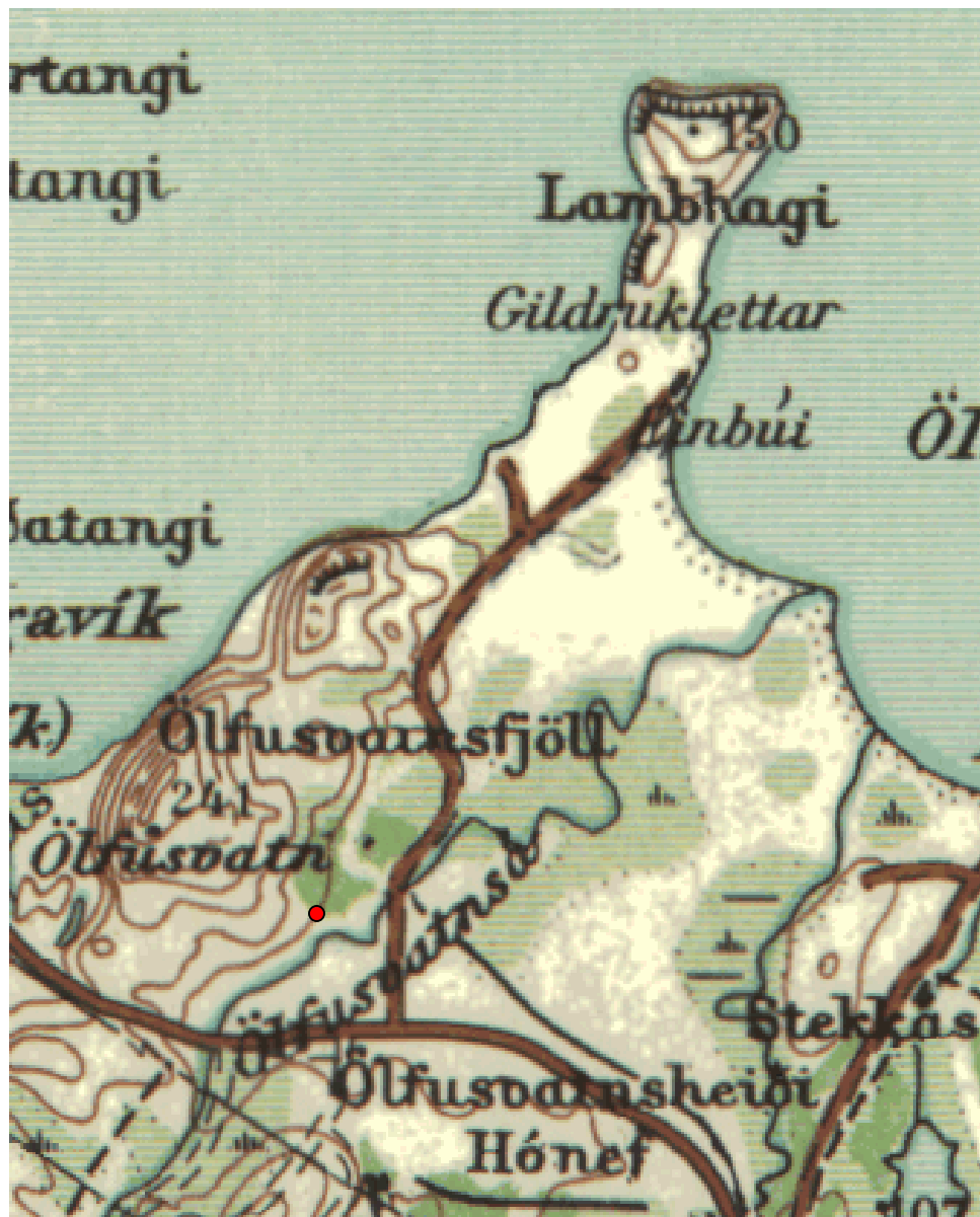
Mynd 1. Yfirlitskort af svæðinu. Fjárborgin er merkt með rauðu inn á kortið.

Föstudaginn 17. nóvember var haft samband við Þjóðminjasafnið og tilkynnt um að til stæði að leggja nýjan veg í landi Ölfusvatns Í Grafningshreppi (Táknatala sveitarfélags 8715) niður að sumarbústaðabyggð við Þingvallavatn, og væri fyrirsjáanlegt að hann mundi spilla gömlum rústum sem þar væru á svæðinu.