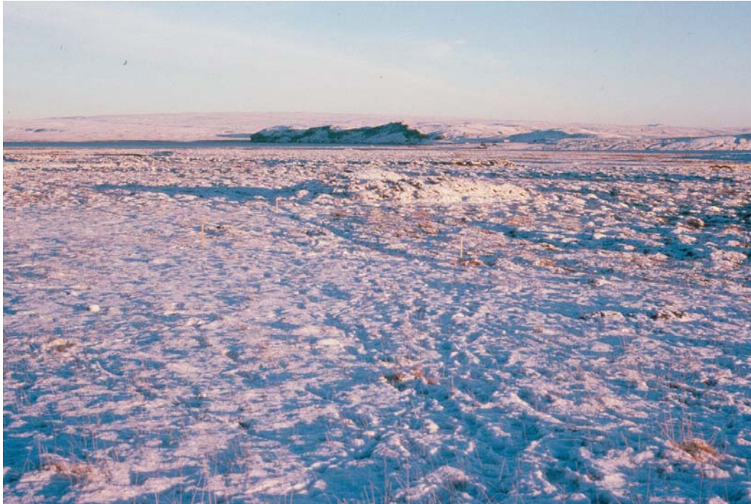
Mynd 2. Horft til norðausturs yfir svæðið. Stikur marka nýtt vegstæði. Fjárborgin er fyrir miðri mynd. (G.Ó.).

Í ljós kom, að í stórþýfðum móa, um 300 m suðsuðvestan við gamla bæjarstæðið, voru leifar af hringlaga fjárborg, sem lent hafði innan veglínunnar. Tóftin rís um 1,5 m upp yfir þýfið umhverfis og er um 4,2 x 4,7 m breið að innanmáli. Veggirnir eru tæplega 1 m breiðir og um 0,3 - 0,4 m háir að innanverðu, en að utanverðu hallar þeim með nokkrum fláa niður á jafnsléttu. Rof var í vegginn til vesturs. Líklega eru þarna eldri byggingarleifar undir þeirri fjárborg sem nú sést.