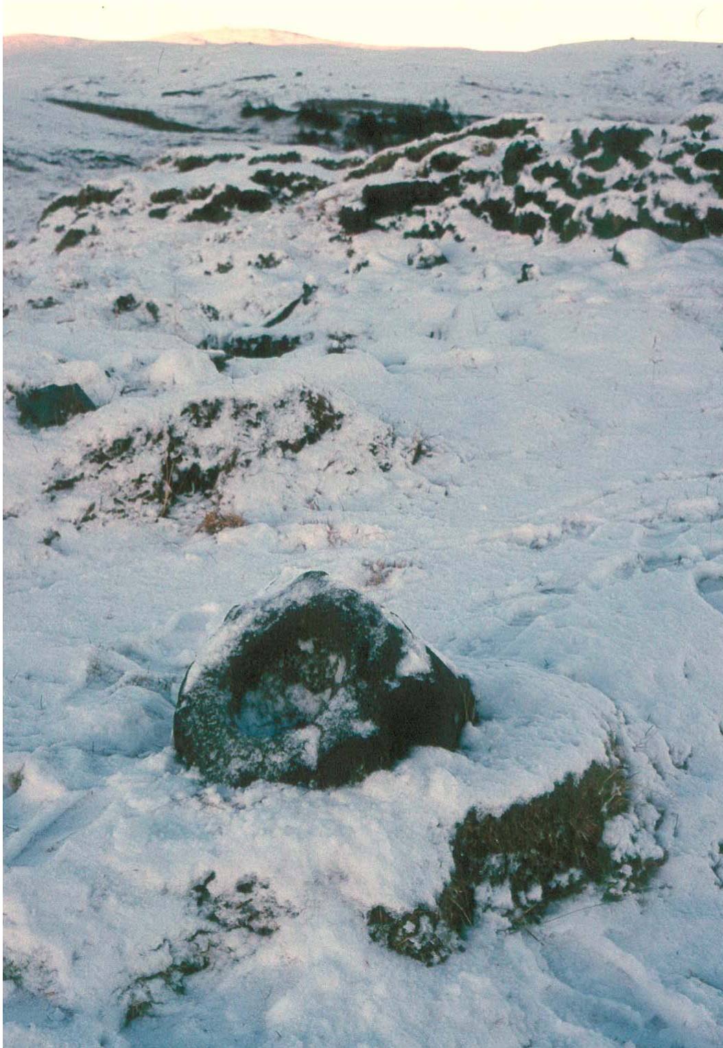
Mynd 5. Á bæjarhlaðinu fyrir framan bæinn er stór bollastein,. Ofan í hann er klappaður um 20 cm breiður og um 10 cm djúpur bolli. Brynjúlfur nefnir einnig þennan stein í frásögn sinni