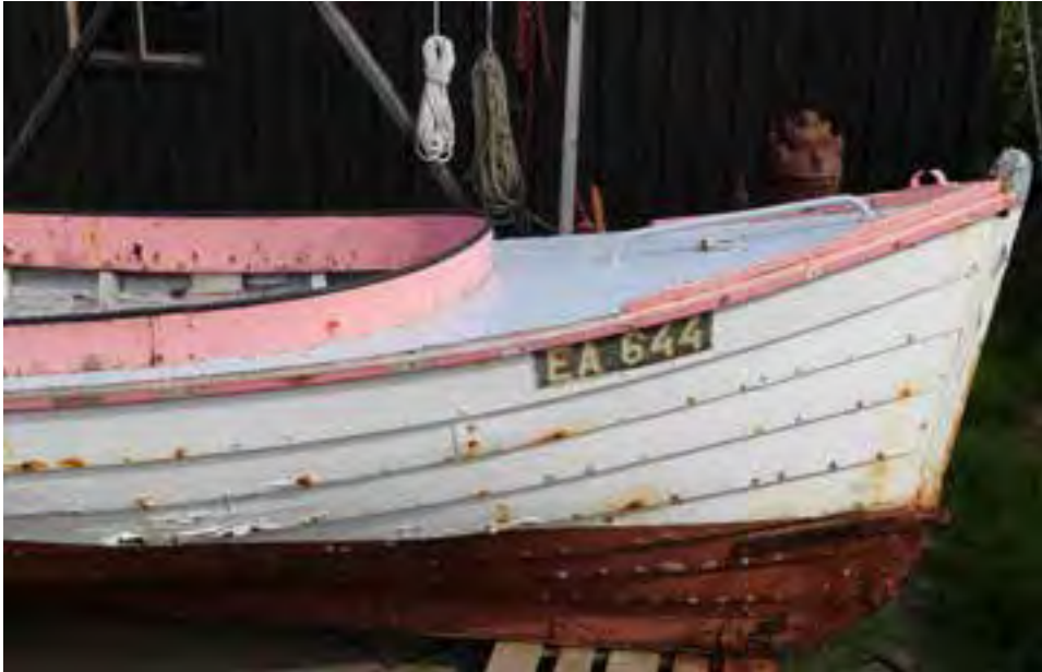
Steingrímur EA 644, framstefni, utandyra. Ljósmynd. HMS 2018

9. Smíðastaður: Látrar við Eyjafjörð, S-Þing. (síðasti báturinn sem þar var smíðaður)