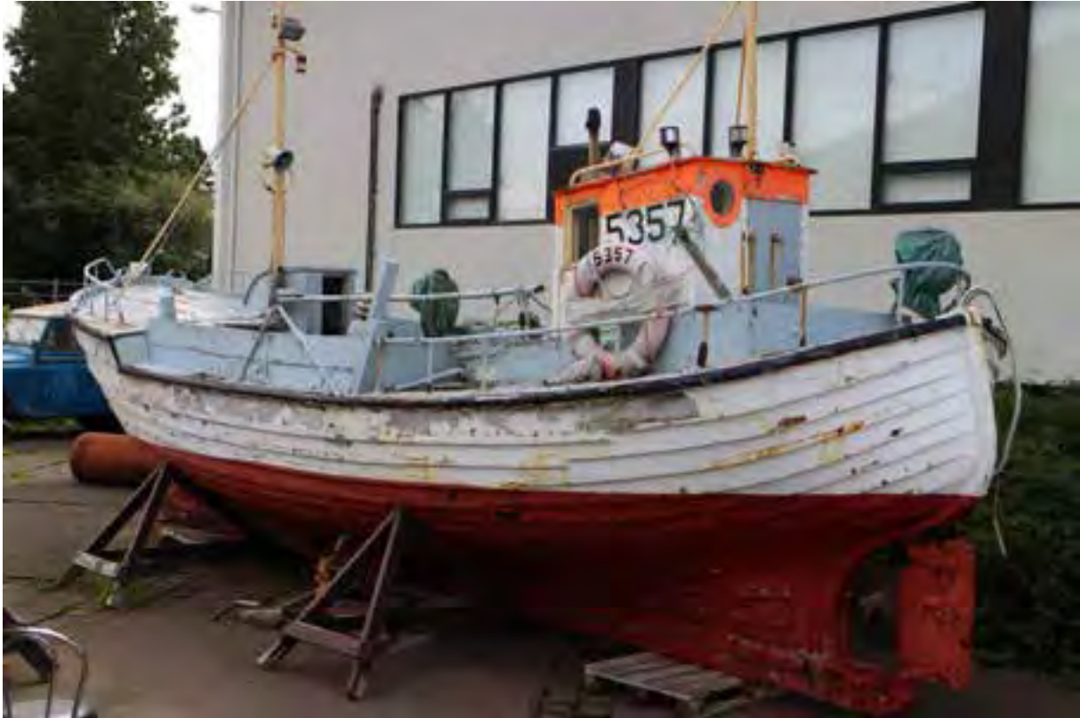
Þráinn ÞH 2 við Safnahúsið, 2018.