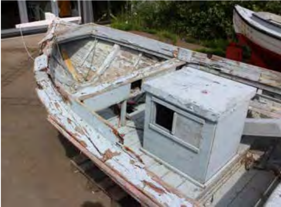
Sæþór TH 56 á útisvæðinu við Safnahúsið á Húsavík, skutur.