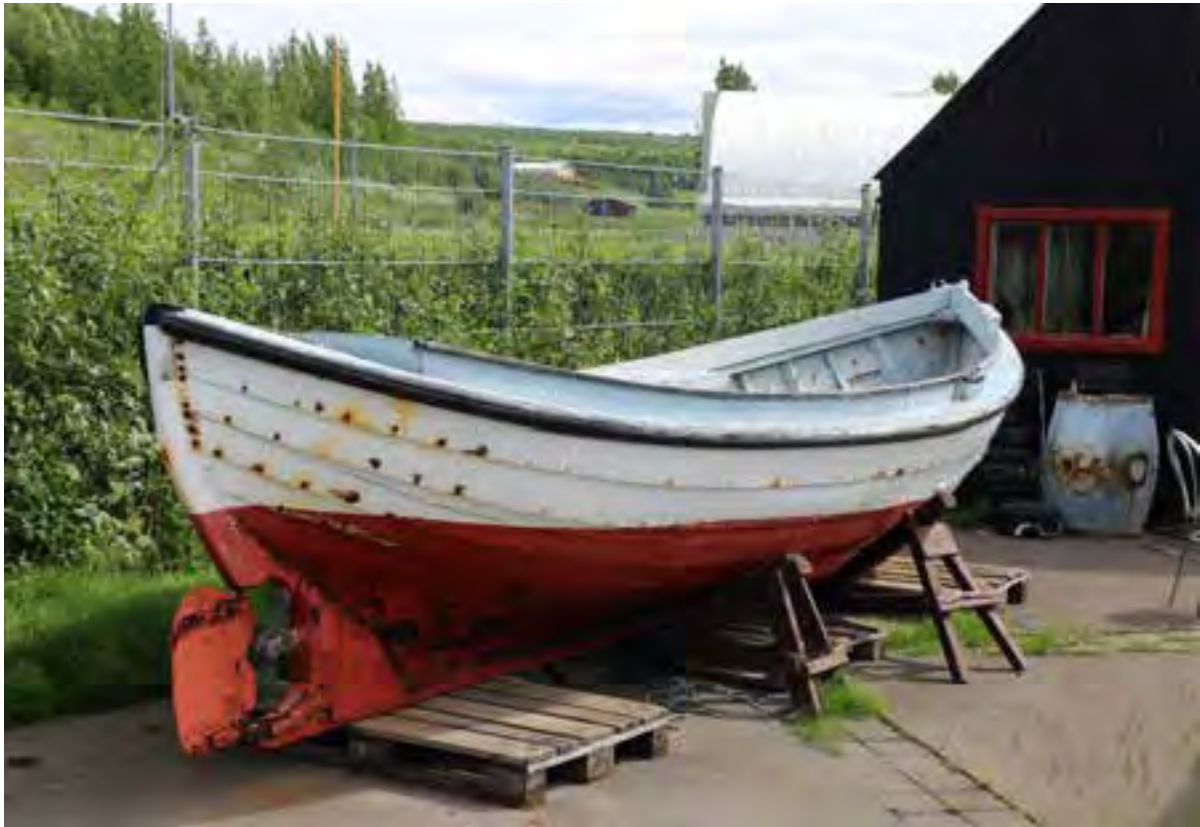
Farsæll ÞH utandyra við Safnahúsið.