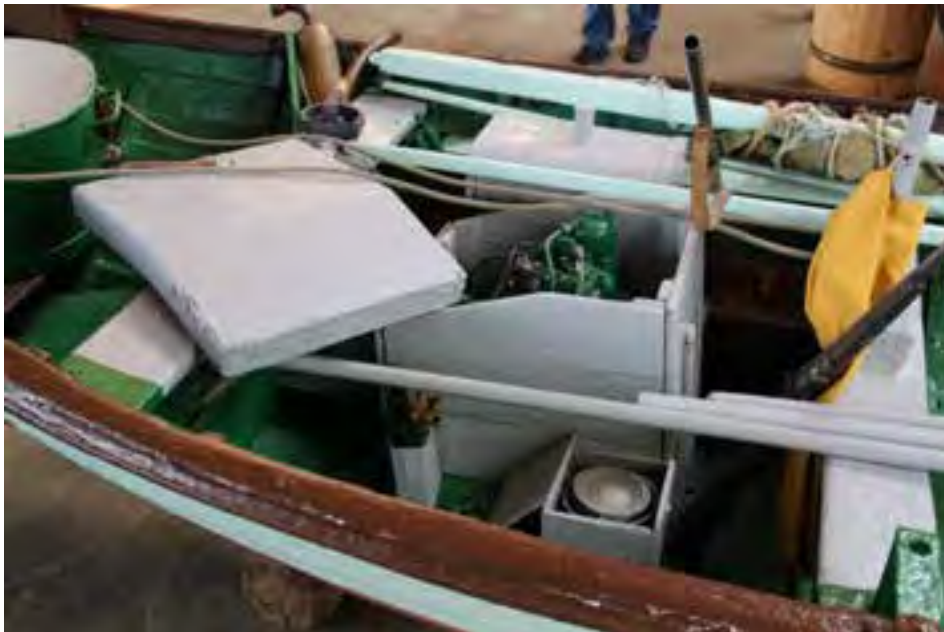
Dagfari; Vél og annar búnaður.

19. Siglingatæki og annar búnaður: Margvíslegur búnaður fylgir bátnum, sbr. meðfylgjandi myndir.