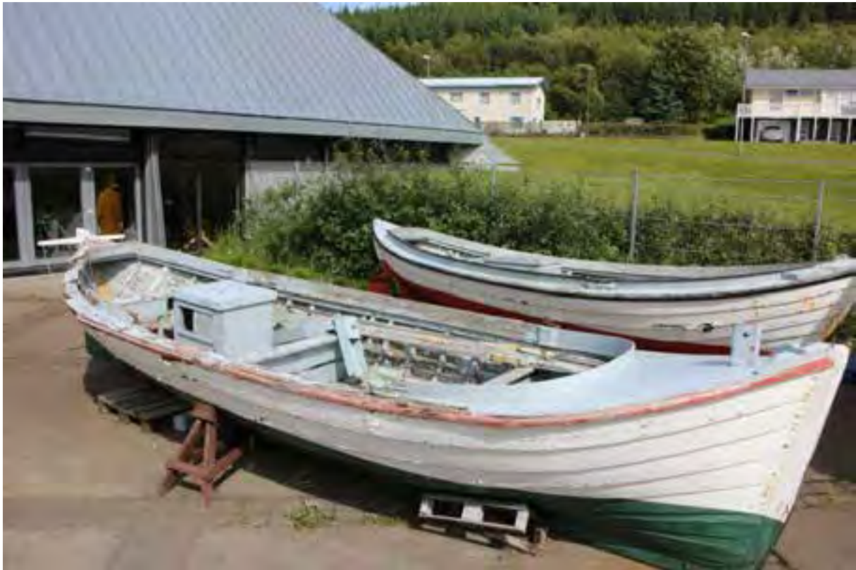
Sæþór TH 56 á útsvæðinu við sjóminjasafnið á Húsavík.