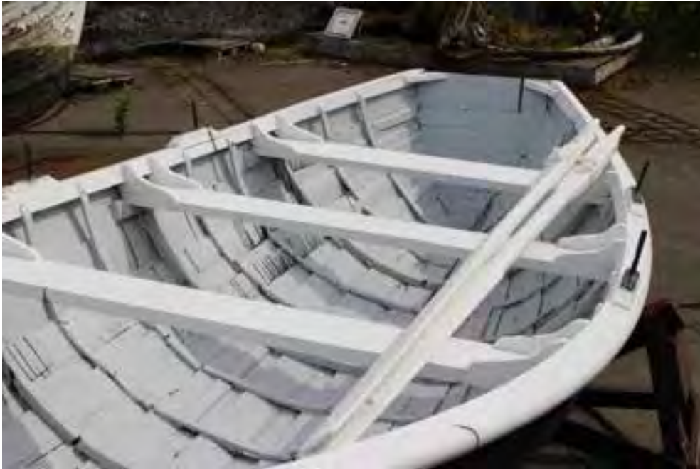
Gaflyttan, 2018, á útisvæðinu við Safnahúsið.