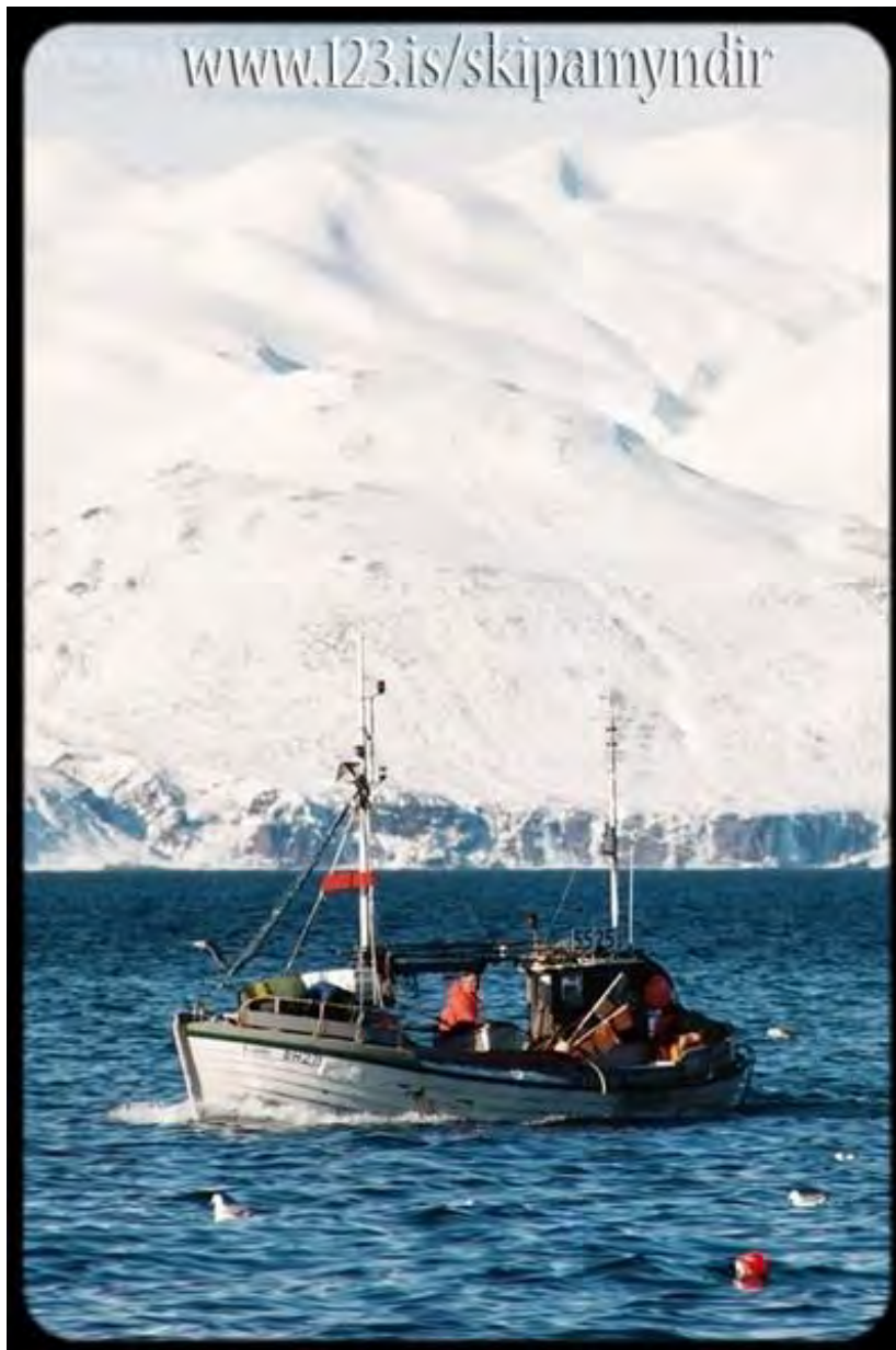
Bjarki ÞH 271 á siglingu á Skjálfandaflóa.

Báturinn var gerður út á Skjálfanda allt til ársins 2002.