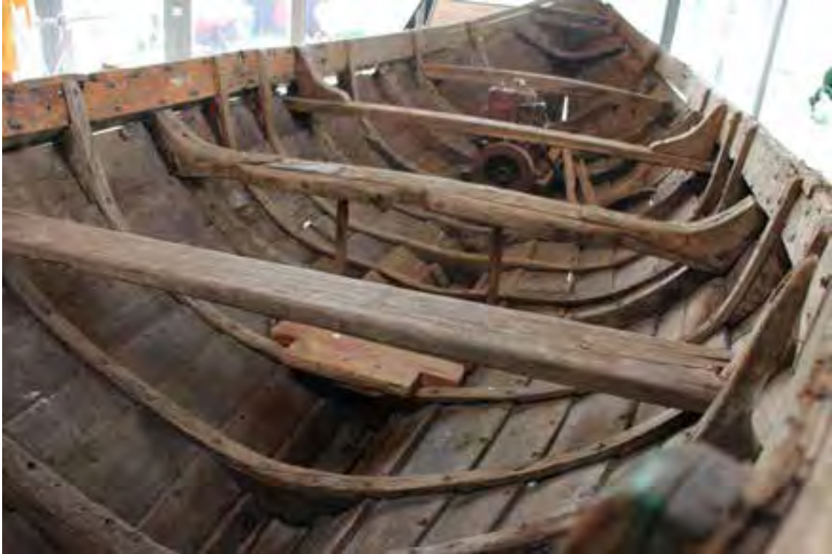
Njörður TH 246. Horft aftur eftir bátnum. Vélin virkar lítil.