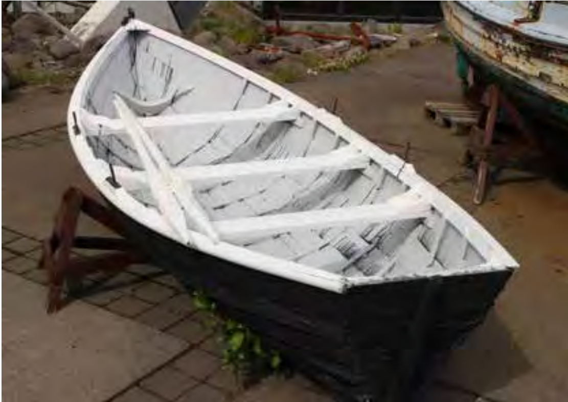
Gaflytta, 2018, á útisvæðinu við Safnahúsið.