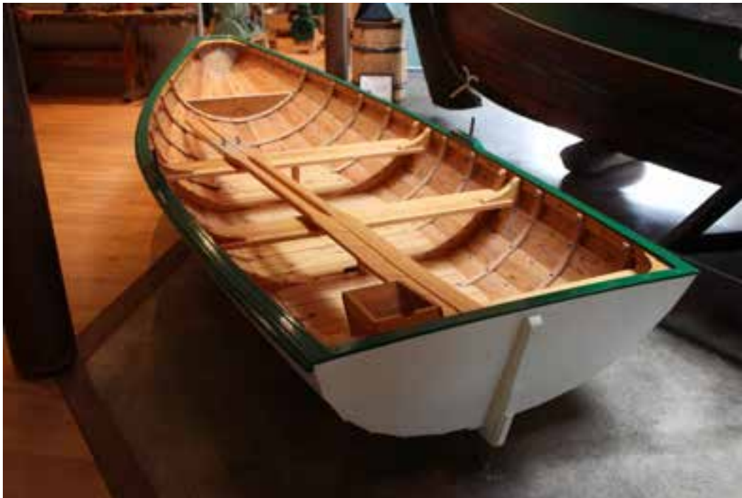
Prammi, nýsmíði, á sjóminjasafninu á Húsavík, 2018.