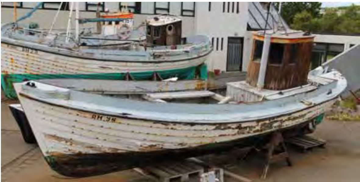
Helgi ÞH 94, 2018.