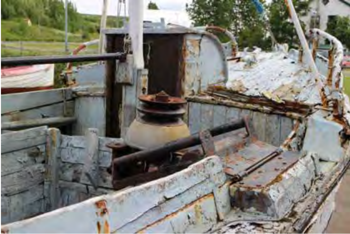
Bjarki ÞH 271, 2018. Eins og sjá má er hann illa farinn.

Báturinn er illa farinn og er líklega ekki á bætandi fyrir safnið að standsetja hann.