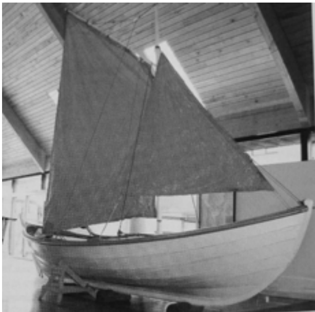
Hreifi undir seglum. Ljósmynd. Saga Húsavíkur. 11

19. Siglingatæki og annar búnaður: Árar, segl, masstur, byssur, goggur o.fl. fylgir bátnum.