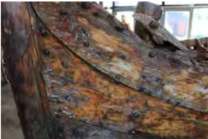
Njörður TH 246, stefnið. Ljós. HMS 2018

Forvitnilegur bátur en illa farinn. Líklega er Njörður eini báturinn sem eftir er af Lófótungum sem nokkuð var keypt af til landsins á fyrstu áratugum 20. aldar.