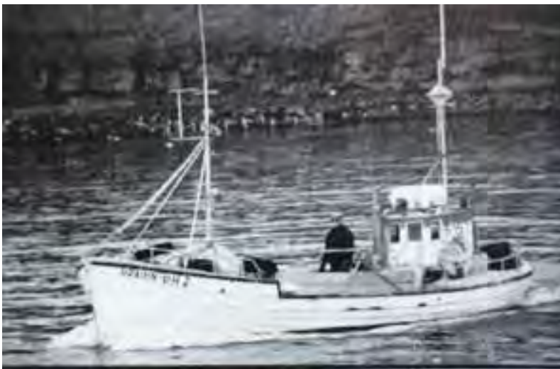
Þráinn PH 2 á stíminu. 69