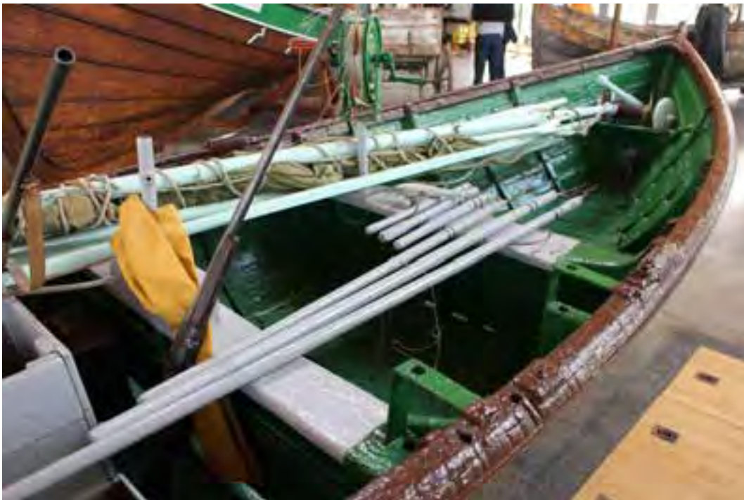
Dagfari; miðskip og barki. Ljósmynd: HMS 2018

Eitt sinn sagði ég við hann, að kunnugir segðu, að hann hefði verið allra manna „hér um slóðir“ fljótastur að hefja byssu og ná sigtun. Spurði ég hann um leið, hvernig hann hefði lært þá fimi, svo hæglátur, sem hann sýndist vera. Hann svaraði: „Ekki er alltaf að marka það, sem gengur í sögum manna á milli. En skotmennska mín – það, sem hún var – kom af sjálfu sér. Ekki var líklegt til góðs árangurs að gaufa við að hefja byssuna, þegar selshöfuð kom úr sjó í færi, og ekki var til neins á kvikandi kænu að sigta lengi. Nei, þá var sigurinn undir því kominn að vera maður augabragðsins. Máskæ átti ég skotheppni mína mest því að þakka, að ég var að mestu laus við glímuskjálfta, en þó með nokkurt kapp í skapi. 24