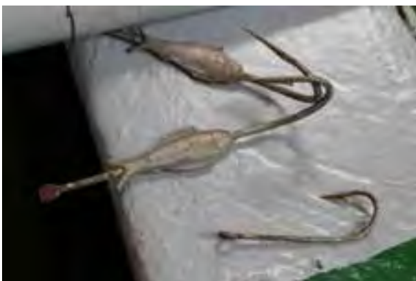
Önglar í Dagfara.