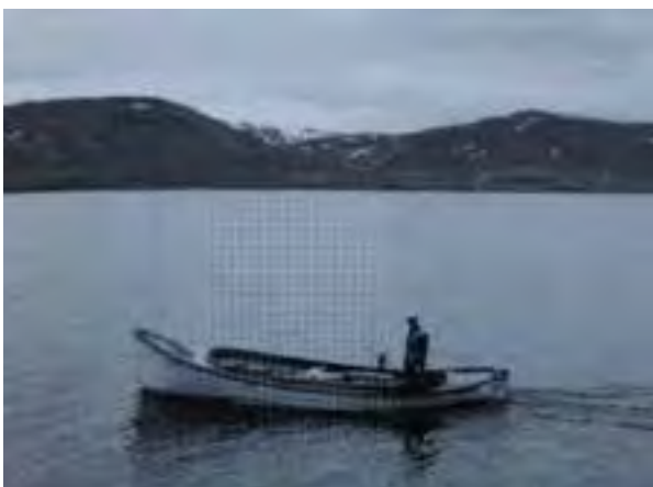
Steingrímur EA 644 eftir að hann hafði verið seldur til Grímseyjar, 1990. 49