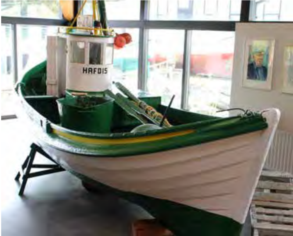
Hafdís ÞH 12 í sjóminjasafninu á Húsavík.