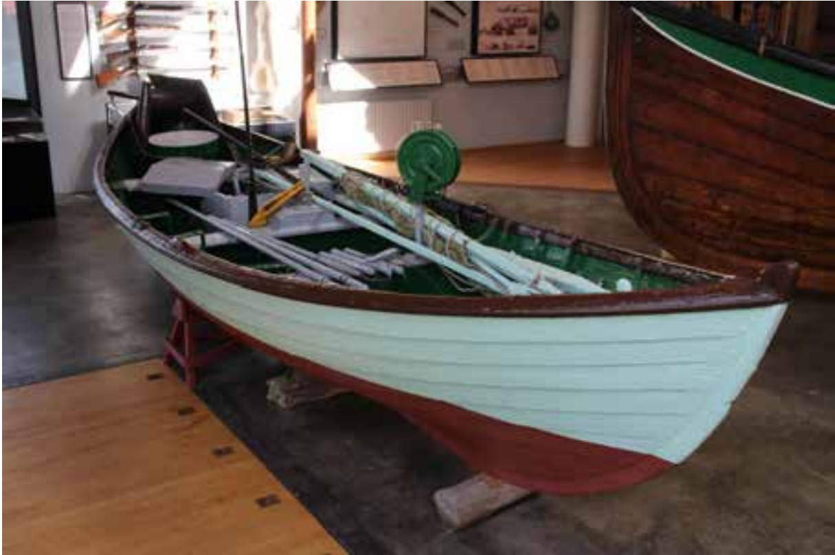
Dagfari, árabátur og síðar vélbátur. 18 Ljósmynd. HMS