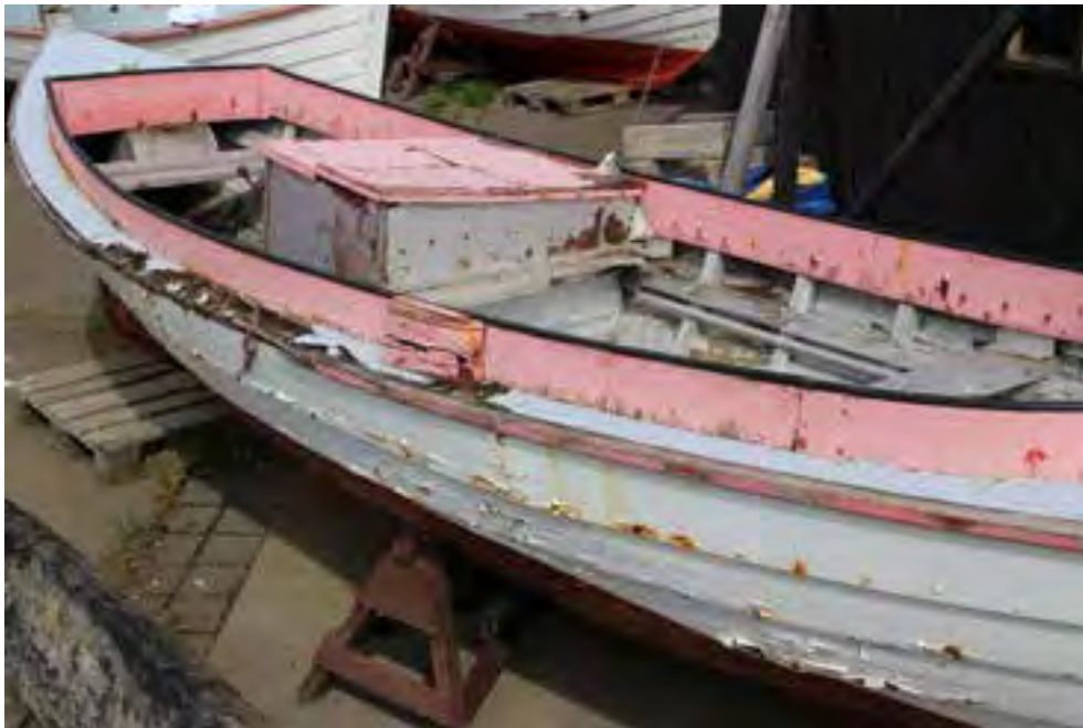
Steingrímur EA 644 utandyra við Safnahúsið.