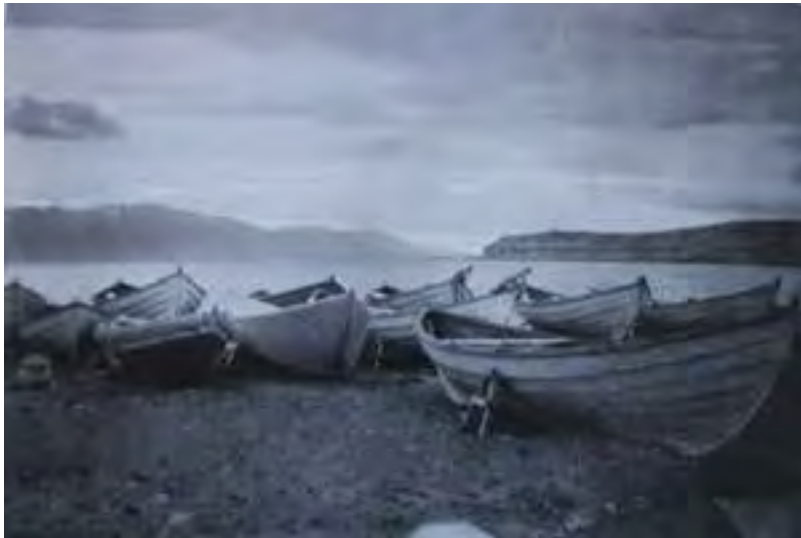
Árabátar í Húsavíkurföru. 1