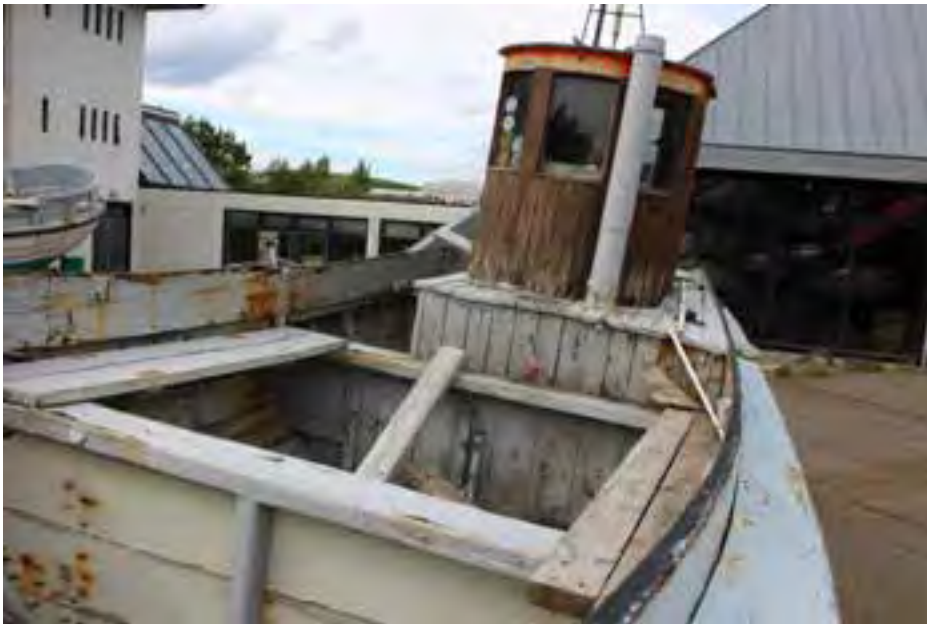
Helgi ÞH 94, 2018.

Báturinn er illa farinn og er líklega ekki á bætandi fyrir safnið að standsetja hann.