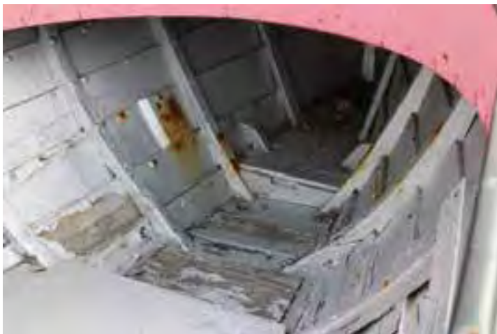
Steingrímur EA 644 utandyra við Safnahúsið, barkinn.

Báturinn er etv. sá eini sem á uppruna sinn við austanverðan Eyjafjörð á fyrri hluta 20. aldar. Á þeim slóðum höfðu margir viðurværi sitt af sjónum um aldir. Báturinn er í einna bestu ástandi af þeim eru geymdir utandyra við Safnahúsið en þarf að fara inn í hús eins og aðrir.