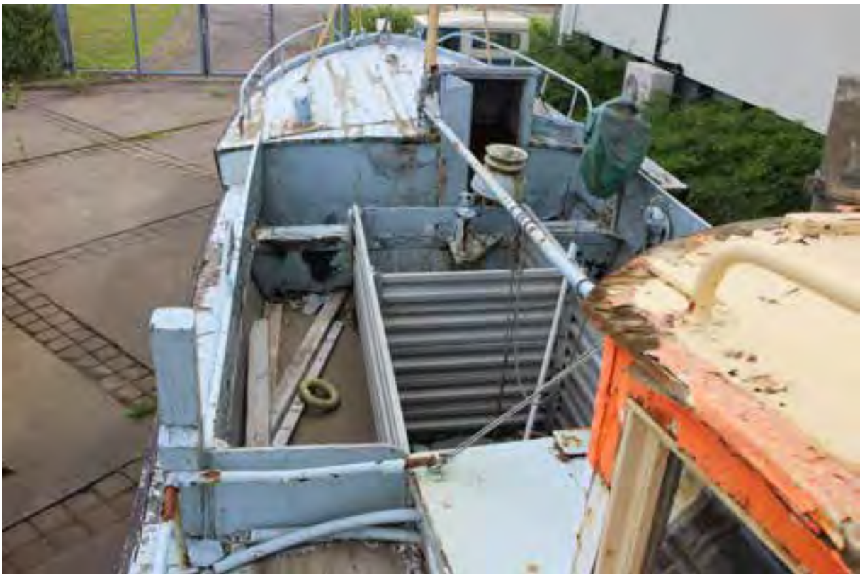
Þráinn ÞH 2 við Safnahúsið, 2018, dekkið og lúkarinn.