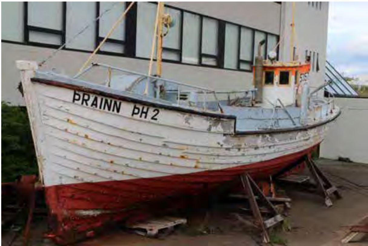
Þráinn ÞH 2 við Safnahúsið, 2018.