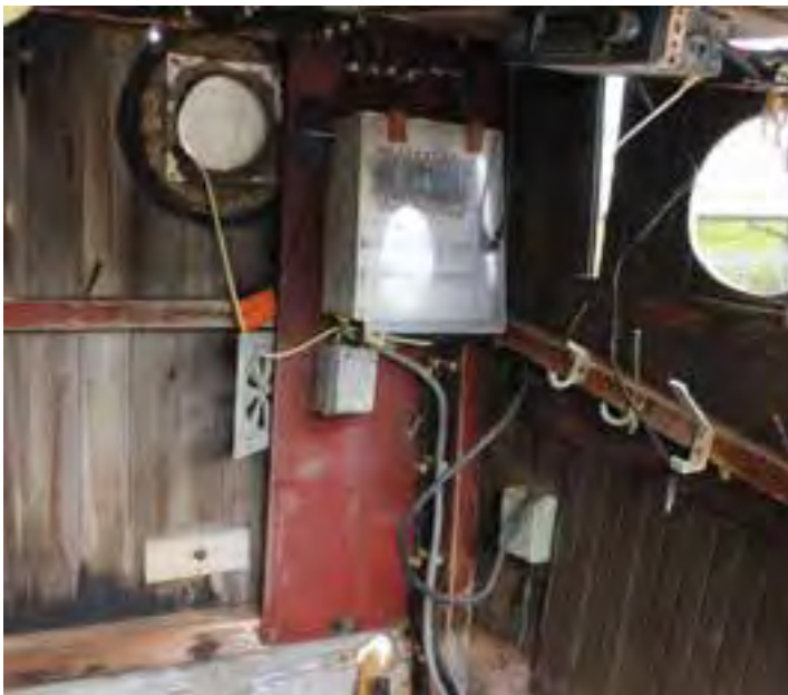
Bjarki ÞH 271. Fátt er eftir í stýrishúsinu. Ljós. HMS 2018