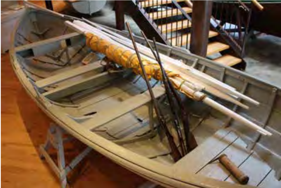
Horft ofan í Hreifa.

Í landi Húsavíkur eru góðar aðstæður til selveiða. Nokkrir bátar stunduðu þær á hverju ári, t.d. voru þeir 12 árið 1887. Ekki hafa fundist sagnir um að selabátar hafi farist en oft munaði litlu, enda veiðarnar stundaðar að stórum hluta um miðjan vetur. Upp úr aldamótum 1900 voru sennilega flestir selabátarnir smíðaðir af Júlíusi Sigfússyni bátasmið. Til er mæling, mynd og lýsing af bát sem hann smíðaði árið 1912. Selabátarnir voru einnig notaðir til annarra veiða. 14