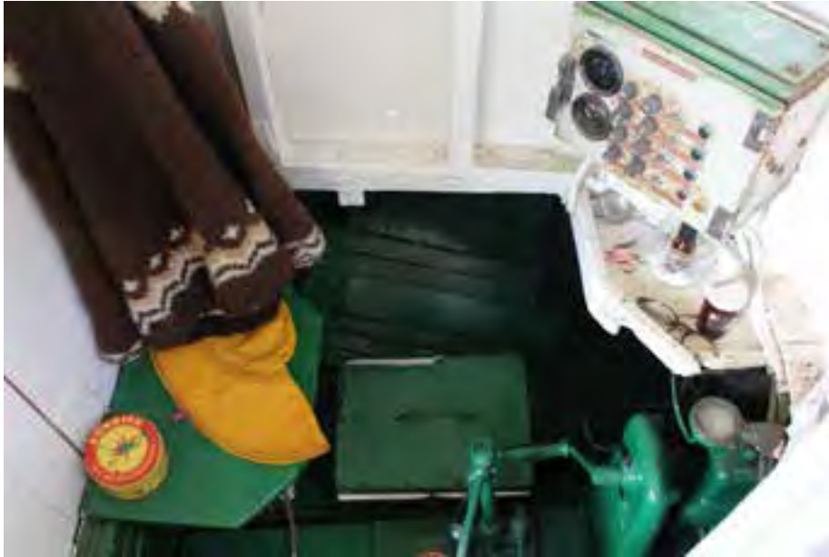
Hafdís ÞH 12, úr stýrishúsinu. Ljósmynd. HMS 2018

12. Smíðaeefni og samsetning skrokks: Eik og fura; súðbyrtur