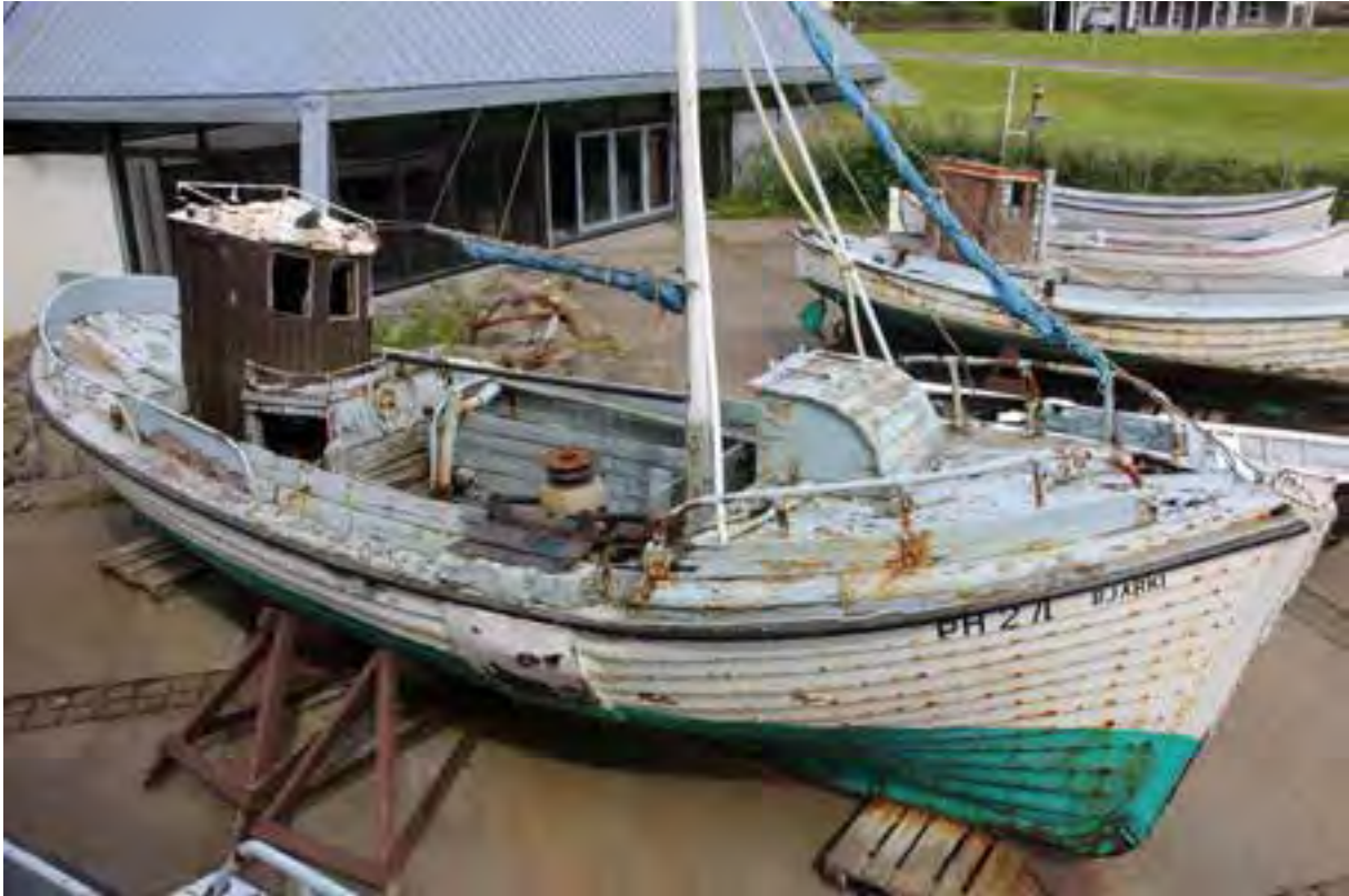
Bjarki PH 271 á útisvæði sjóminjasafnsins í Safnahúsinu á Húsavík.