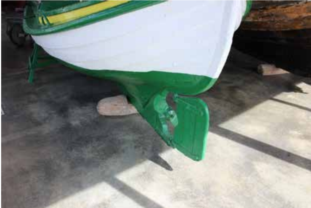
Hafdís ÞH 12, skutur.