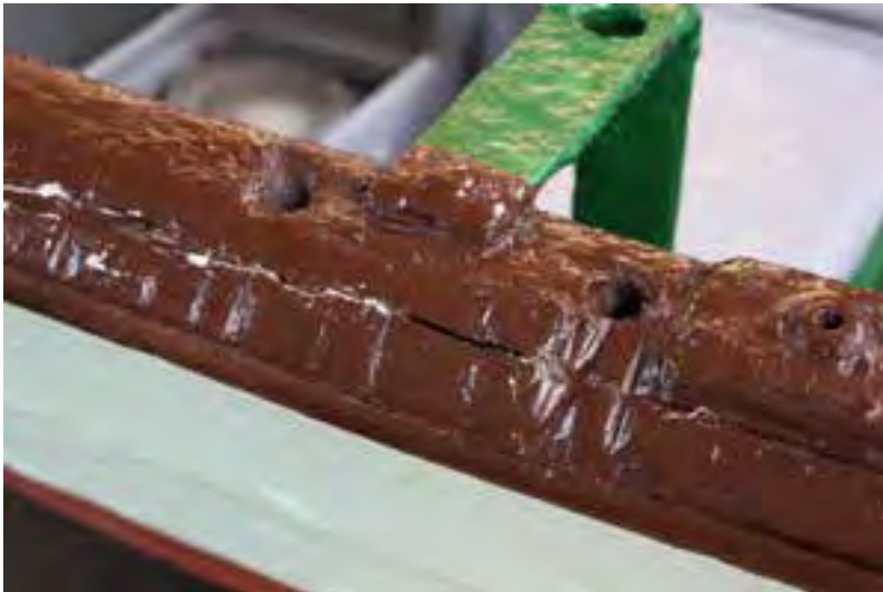
Dagfari; slit á borðstokk.

Áhugaverður bátur fyrir ýmissa hluta sakir, m.a. uppruna og sögu. Mikið af búnaði fylgir bátnum sem eykur gildi hans verulega.