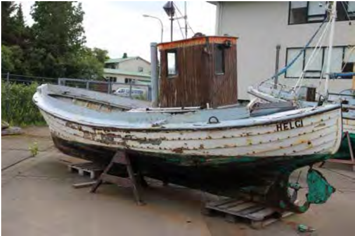
Helgi PH 94, 2018. Ljósmynd. HMS