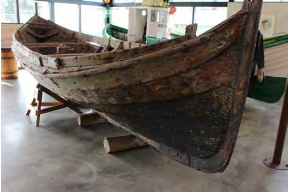
Njörður TH 246. Ljós. HMS 2018