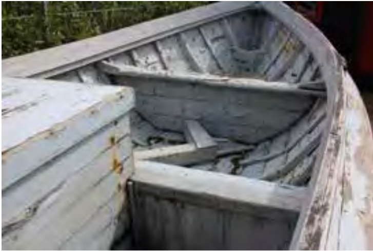
Farsæll þH utandyra við Safnahúsið, barkurinn.

Heimildir eru fáar – aðallega skýrslan frá 2001 og etv. Saga Húsavíkur IV.