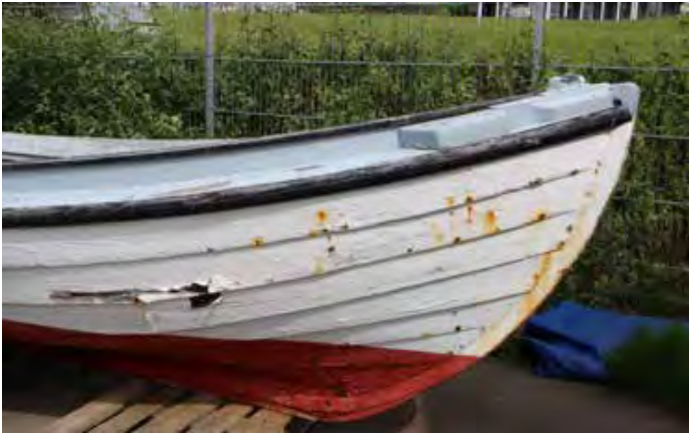
Farsæll þH utandyra við Safnahúsið, framstefni.