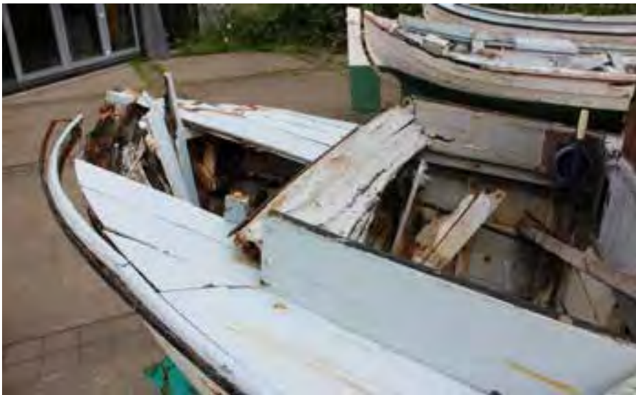
Helgi ÞH 94, 2018.