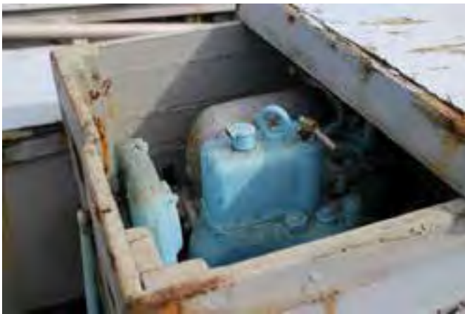
Vélin í Farsæli. Ljós. HMS 2018