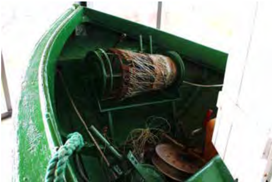
Hafðís ÞH 12, veiðarfæri í skut.