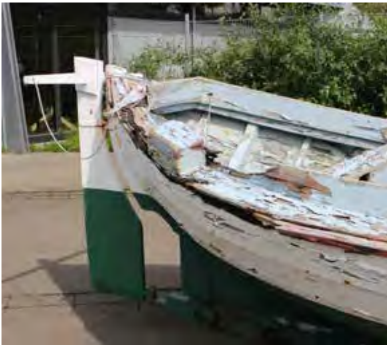
Sæþór TH 56 á útisvæðinu við Safnahúsið á Húsavík, afturstefni. Ljós. HMS 2018