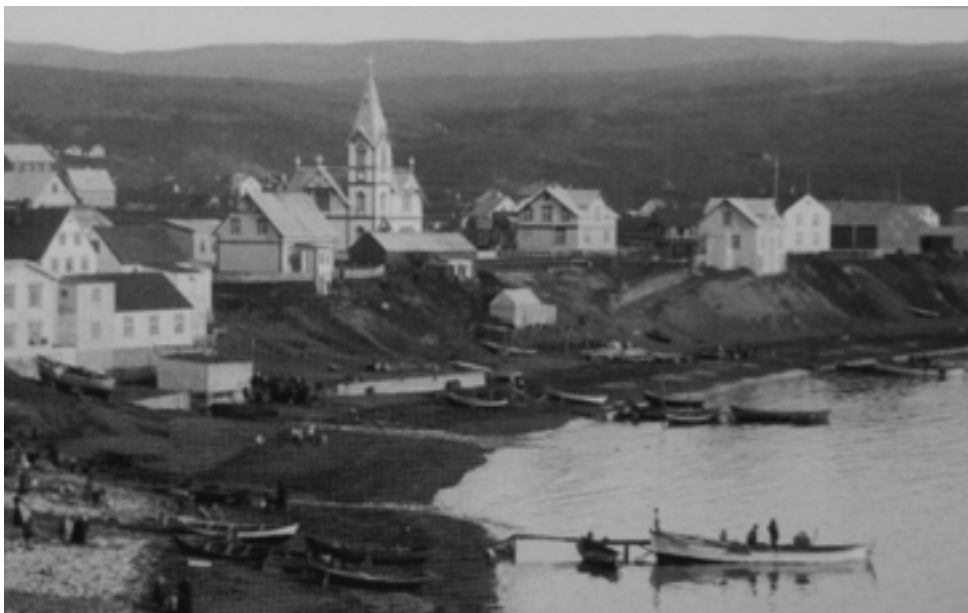
Höfnin á Húsavík árið 1910. Báturinn fremst á myndinni til hægri er fyrsti vélbátur Húsvíkinga. 4