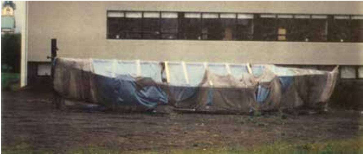
Hrafn árið 1995, utandyra með yfirbreiðslu.