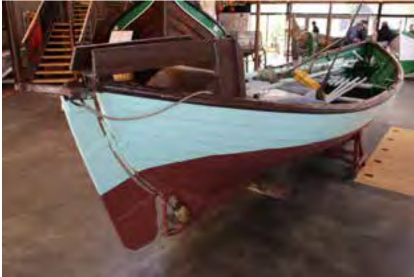
Dagfari; skutur.