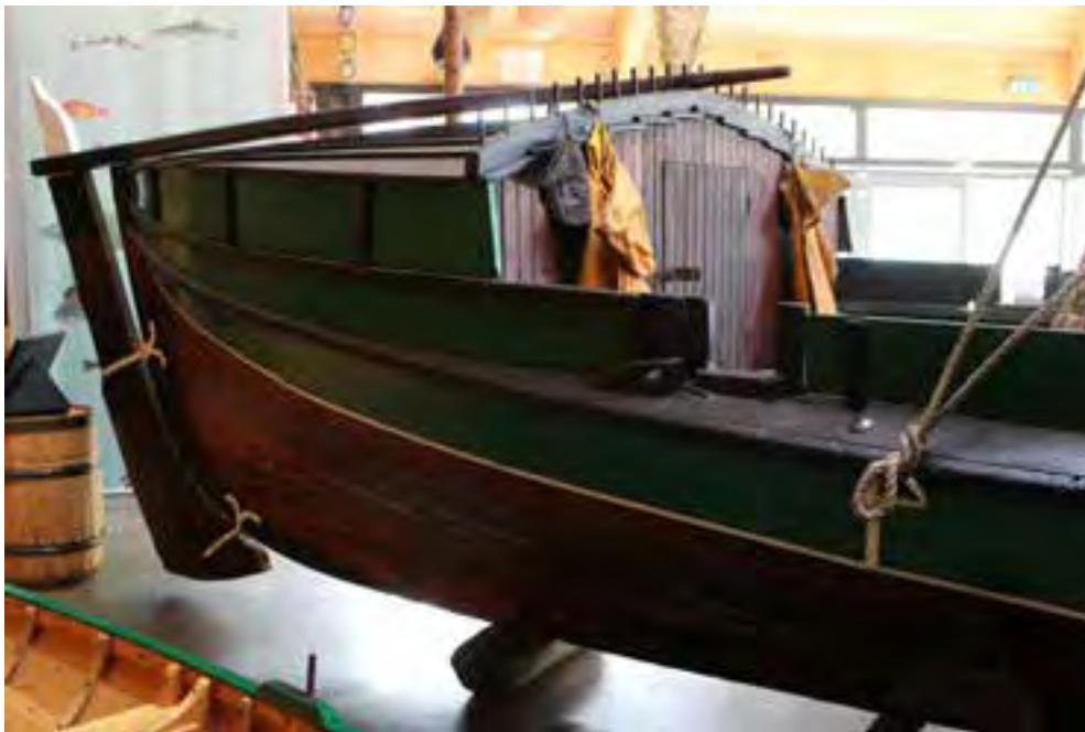
Hrafn á sýningu sjóminjasafnsins í Safnahúsinu á Húsavík, skutur.