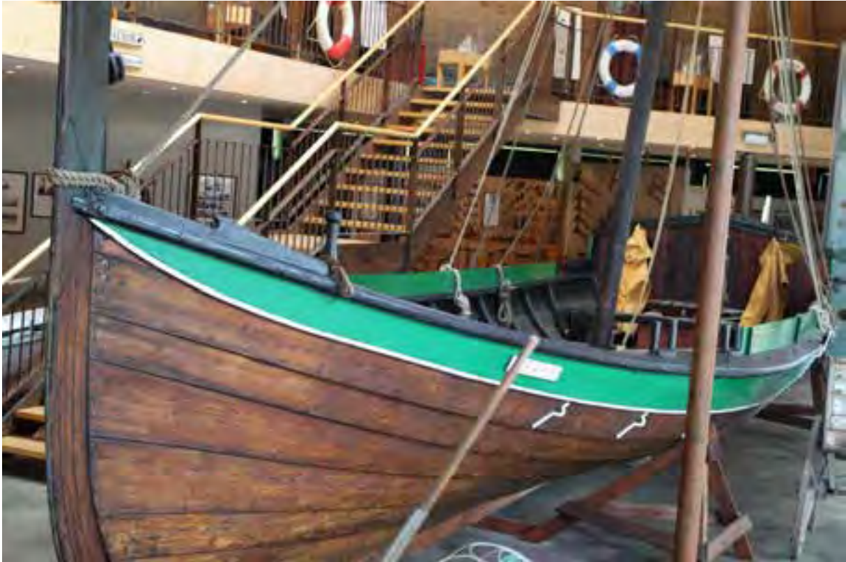
Hrafn á sýningu sjóminjasafnsins í Safnahúsinu á Húsavík.