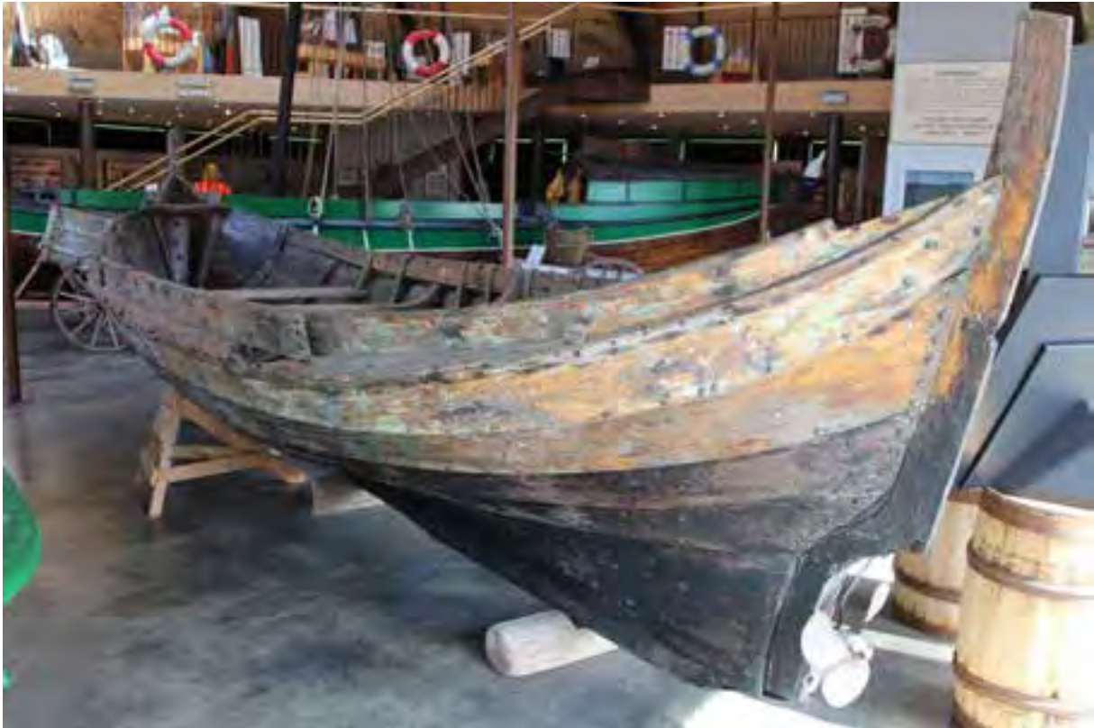
Njörður TH 246, skutur.

Tveir endurgerðir Aafjord-bátar eru til á Íslandi, í Reykjavík og á Húsavík. Þeir voru gjöf frá Noregi í tilefni af 1100 ára afmæli Íslandsbyggðar 1974. Þeir munu vera fyrstu endurgerðu teinæringarnir af þessari gerð en síðan þá hafa nokkrir slíkir verið smíðaðir í Noregi. 60