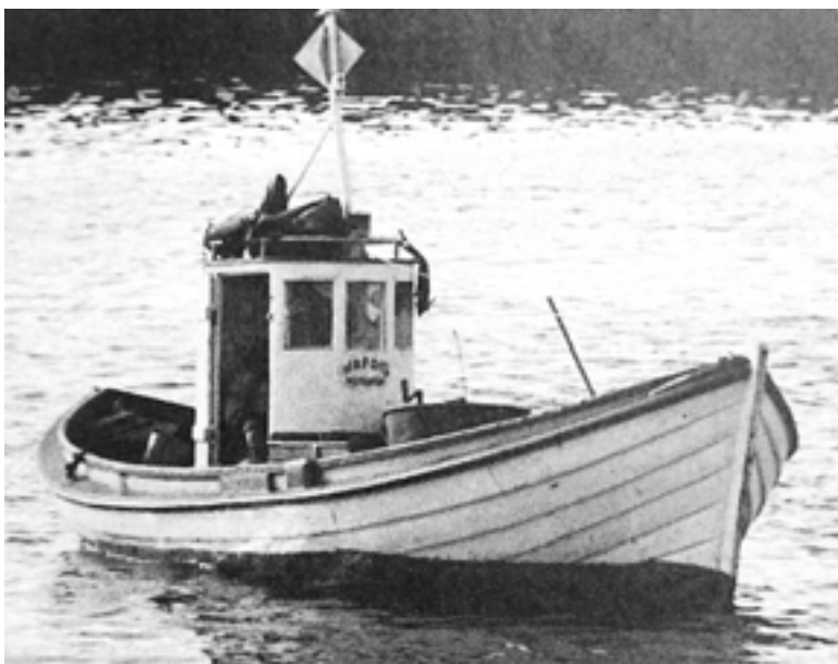
Hafdís ÞH 12 á siglingu. 44