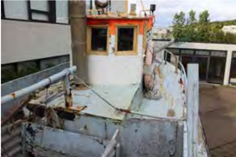
Þráinn PH 2 við Safnahúsið, 2018.