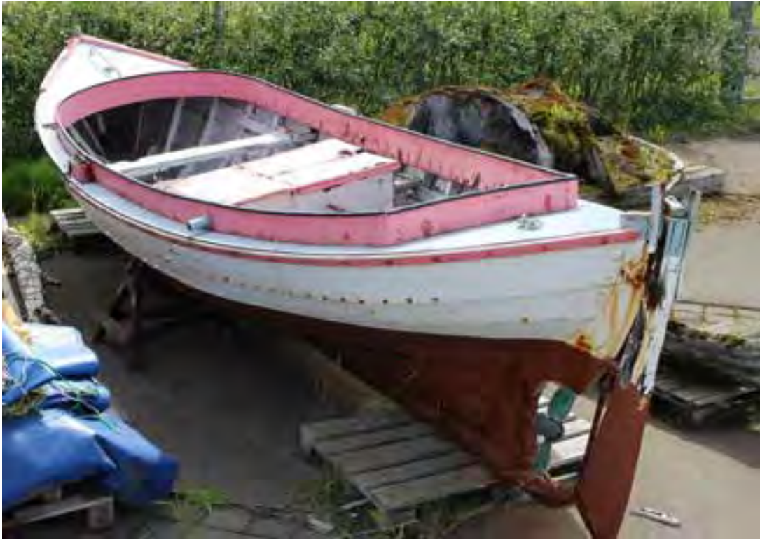
Steingrímur EA 644 utandyra við Safnahúsið.