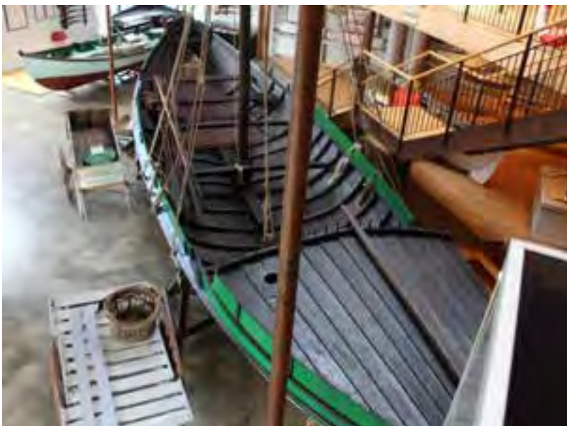
Hrafn á sýningu sjóminjasafnsins í Safnahúsinu á Húsavík. Ljós. HMS 2018

Báturinn er veglegur og hefur sýningargildi eins og aðstandendur Safnahússins á Húsavík hafa lagt áherslu á. Hann mun líklega þjóna hlutverki sem staðgengill landnámsskips meðan safnið á ekki eiginlega eftirgerð. Og raunar er ekki full víska fyrir því hvernig bátar landnámsmanna voru.