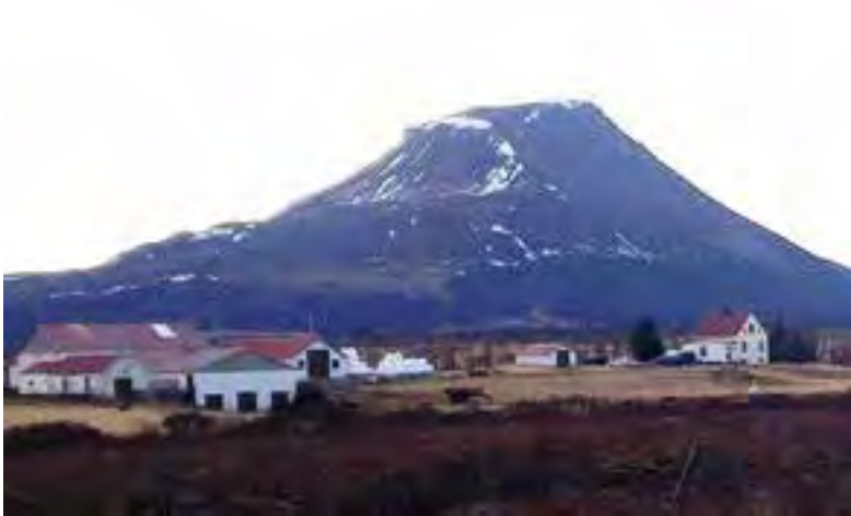
Ærlækur í Öxarfirði. Ljósmynd. Bændablaðið 2017.

Byttan var upphaflega notuð í Mýrarkoti á Tjörnesi við margskonar veiðiskap, hrognkelsa- og silungsveiði og skak á sumrin, auk selveiða. Báturinn var seldur þaðan austur í Ærlæk í Öxarfjarðarhreppi og eftir það aðallega notaður við silungsveiði á Hafursstaðavatni.