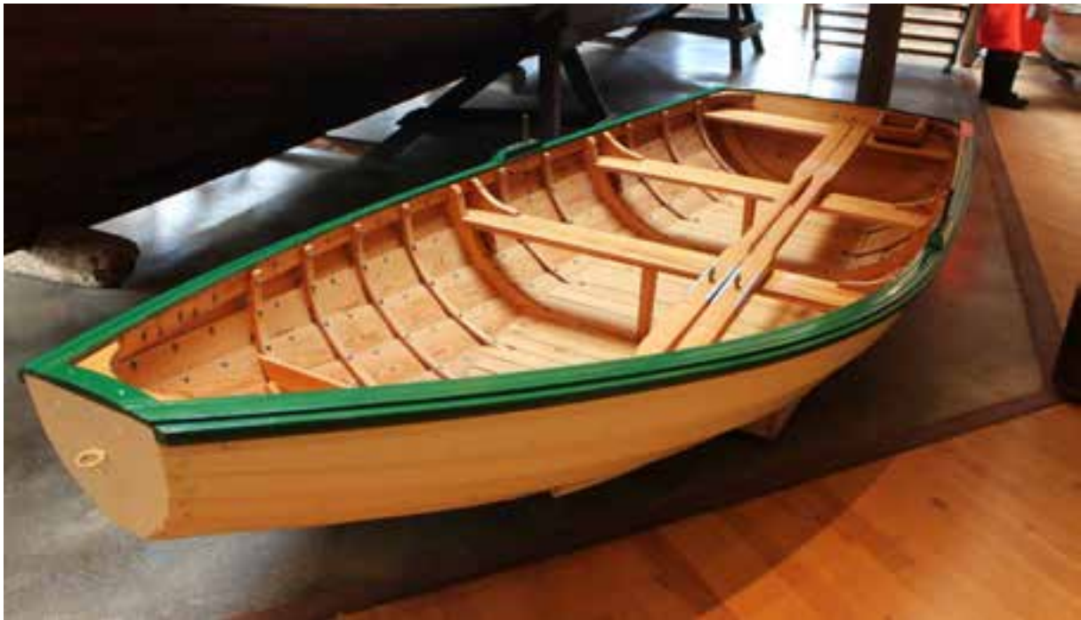
Prammi, nýsmíði, á sjóminjasafninu á Húsavík, 2018.