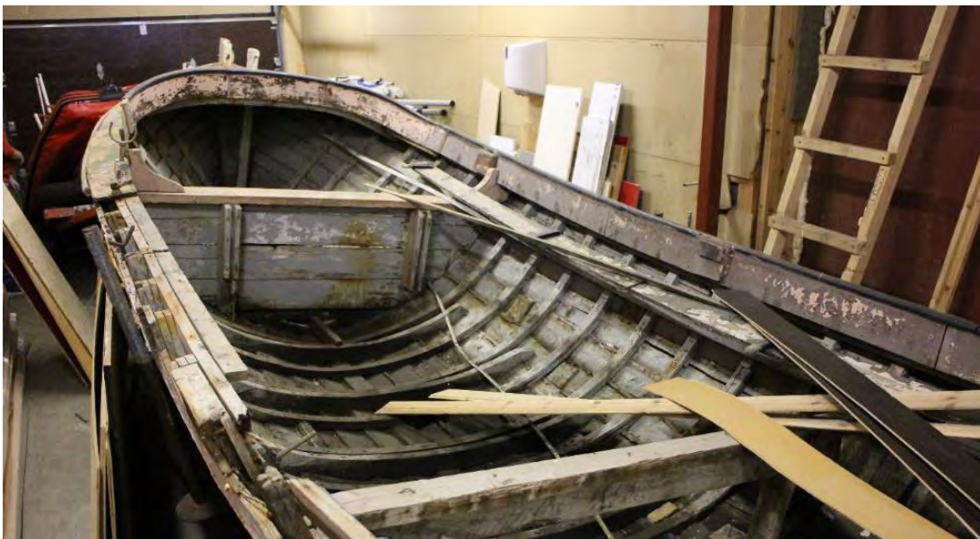
Guðmundur S GK 56, 2018. Horft fram eftir bátnum.