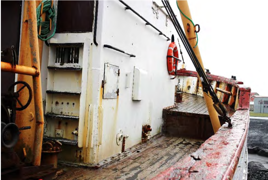
Baldur KE 97, 2018. Horft fram eftir dekkinu. Ljós. HMS.