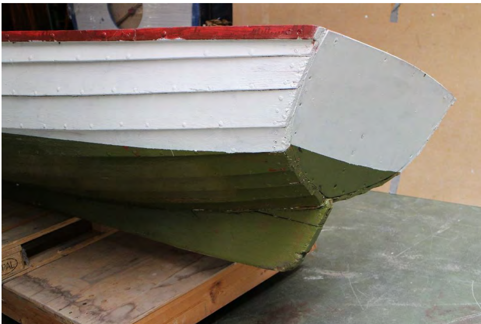
Léttabátur frá Höfnum, 2018. Kjölurinn er óvenjuhár aftan til. Ljós. HMS