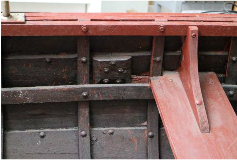
Léttabátur frá Höfnum, 2018. Borðsokkur, síða og þófta. Ljós. HMS