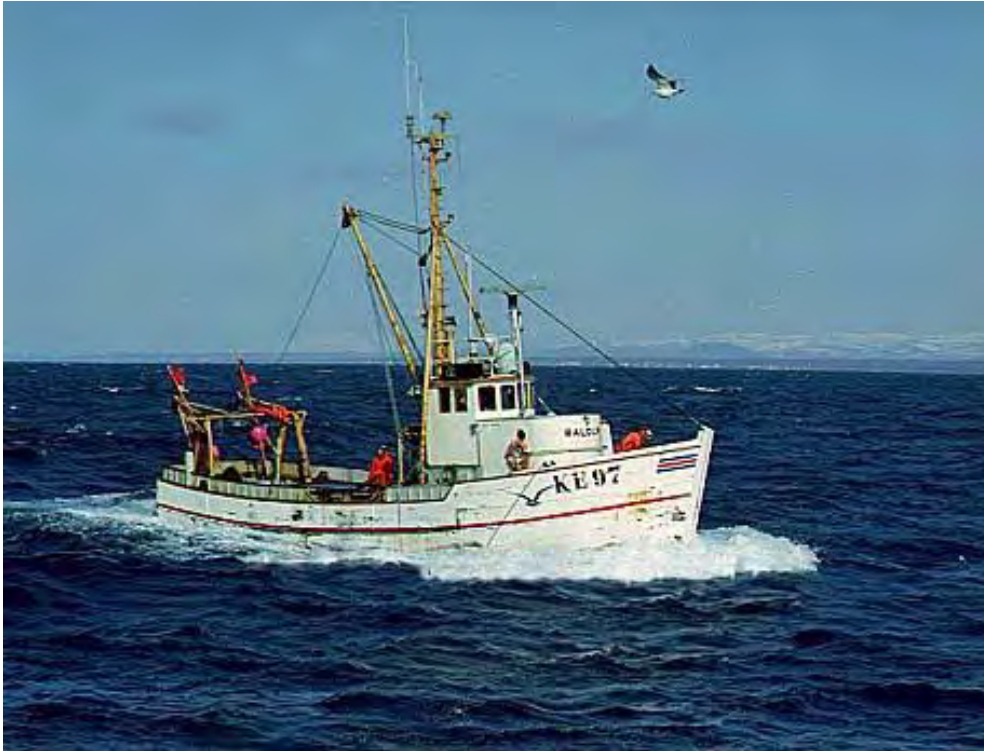
Baldur KE 97 á siglingu.