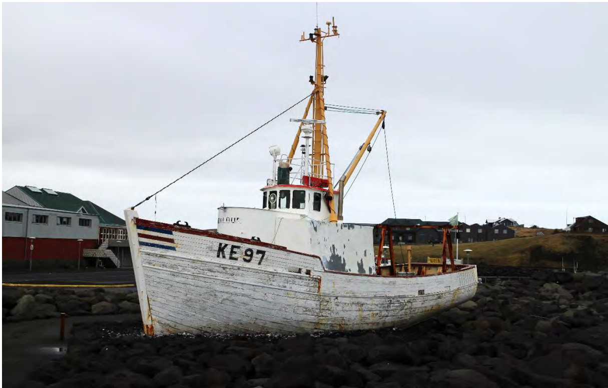
Baldur KE 97 í nausti í Grófinni, 2018.