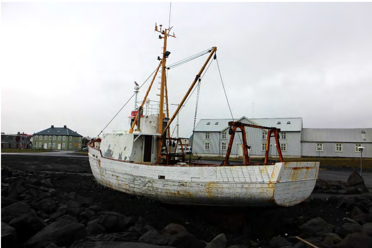
Baldur KE 97, 2018. Ljós. HMS.