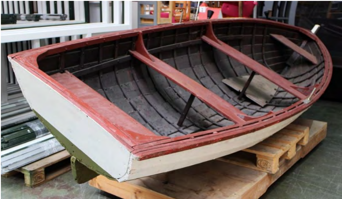
Léttabátur frá Höfnum, 2018.