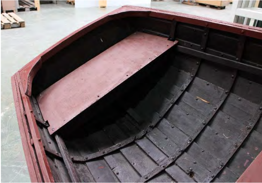
Léttabátur frá Höfnum, 2018. Skuturinn að innan.

Stílhreinn bátur og fallegur. Aldur vantar.