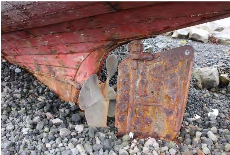
Baldur KE 97, 2018. Stýri og skrúfa. Sjá má hvernig báturinn situr í mölinni. Ljós. HMS.