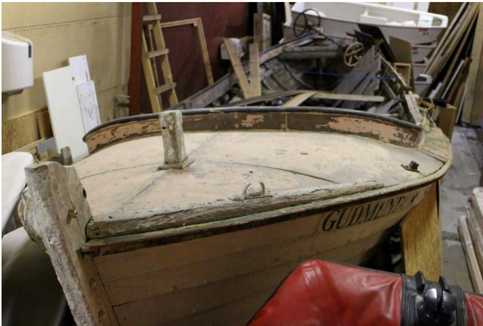
Guðmundur S GK 56. Efri myndin er sennilega frá því um 1990. Sú neðri er frá 2018, tekin í geymslu byggðasafnsins, í Ramma-húsinu, án stýrishúss og vélar.