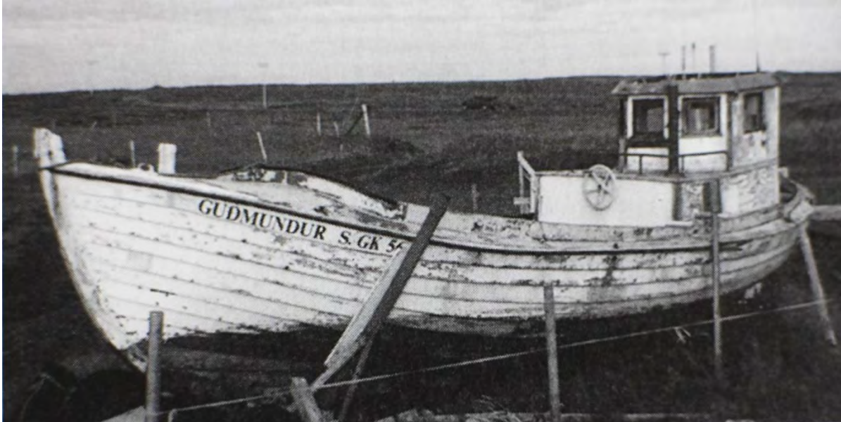
Guðmundur S GK 56. Myndin er úr bókinni Íslensk skip. Bátar I. Líklega er hún frá því um 1990. Á henni sést m.a. stýrishúsið og hvar það var staðsett.