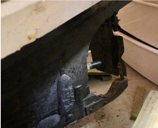
Guðmundur S GK 56, 2018. Hæll og öxull. Skrúfunar vantar.