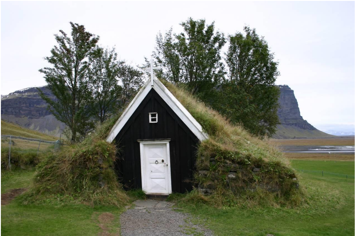
Bænhúsið á Núpsstað. GLH 2007.