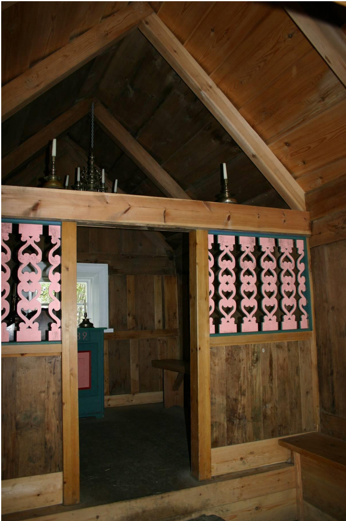
Bænbúsið á Núpsstað, kórþil. GLH 2007.